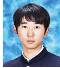
大阪大学医学部医学科