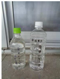
水やり用ペットボトルもいつの間にか出現。