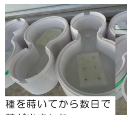
種を蒔いてから数日で芽が出ました。

リーフレタスと小松菜栽培 技術の時間で、リーフレタスと小松菜を栽培しています。毎日どんどん成長していくのが楽しみです。早く大きくな～れ♪