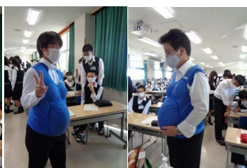
かわいい妊婦さんです♪ お腹には約 7 kg の重し！