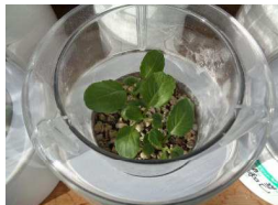
今はこんな感じです。