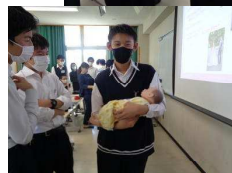
こちらは生後 10 ヶ月の赤ちゃんと同じ位の人形です。