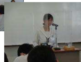
「大山登山と自然破壊」