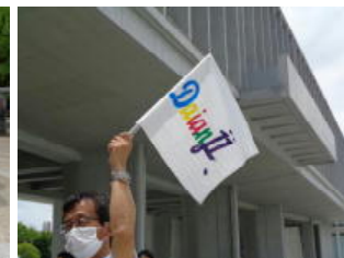
永田先生お手製の Daianji flag