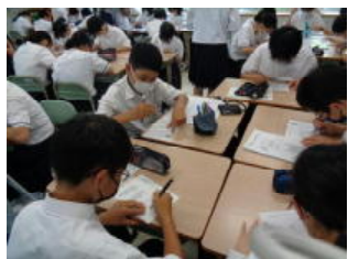
1 年生での英語のパズルやゲーム

6 月 23 日（木）に、「羽ばたけ大安寺 Day」が実施されました。4 年生が、前期課程の 3 年間で取り組んできた様々なことを、後輩たちに発表する行事です。1 年生では英語を使ってのゲーム、2 年生ではジョブシャドウイングについて、3 年生では課題研究の成果発表が行われました。課題研究は、今まさに皆さんが取り組んでいることです。先輩たちのオリジナリティあふれるテーマ設定と研究は、とても参考になったと思います。これからの課題研究の活動を、より充実させていきましょう。