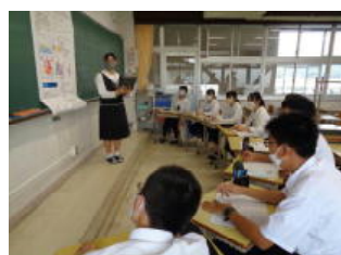
3 年生での課題研究発表